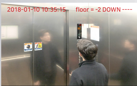
엘리베이터 카메라 영상